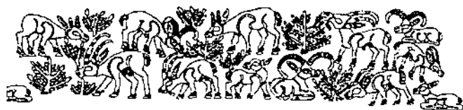
▲ شکل ۳- طرف سنگی، تمدن جیرفت، هزاره سوم پ.م