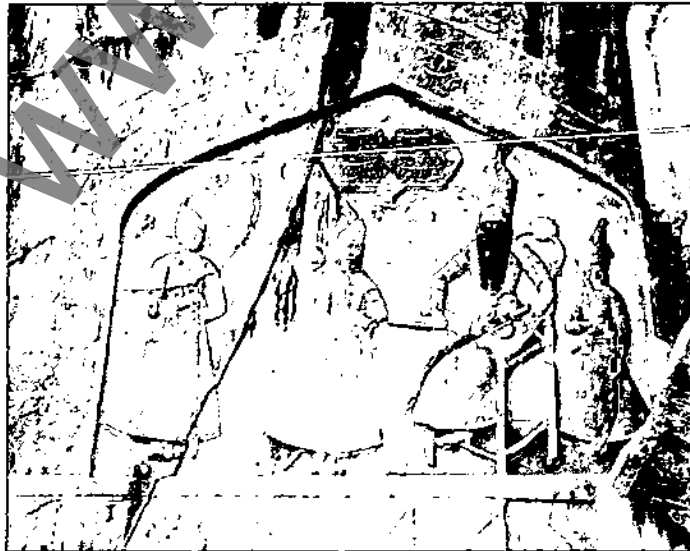
شکل ۱- نقش برجسته محمد علی میرزا دولت‌شاه والی کرمانشاه، طاق بستان، کرمانشاه، ۱۲۰۱ شمسی

این آثار شکوهمند و فاخر در طی روزگار آن متفاوت به همت هنرمندانی گمنام پدید آمده است. هر چند که بسیاری از این آثار به‌ویژه میراث دوران تاریخی به‌مرور به فراموشی سپرده شدند و به شکل داستان‌هایی، بعدها در ساختار روایتی و ادبی به جای ماندند که شناخت آن‌را می‌توان در اثر بزرگ حماسی ایران شاهنامه فردوسی دید. این داستان‌ها به روشنی دلالت بر حقایق تاریخی دارند هرچند به گونه خیال‌پردازانه‌ای ارائه شده‌اند. با این حال پس از گذشت سالیان متمادی سرانجام در سده سیزدهم هجری (۱۹ میلادی) با شکل‌گیری علم باستان‌شناسی توجه خاصی و تحولاتی در زمینه ساخت هنر ایران در ادوار مختلف پدید آمد و از این زمان به بعد میل و علاقه بسیاری از حاکمان و والیان مناطق مختلف را به آثار تاریخی که به دلیل قدرت یا منفعت طلبی و یا با اهداف هنرشناسانه به این جریان جلب کرد و حتی آن‌ها را بر آن داشت تا به ایجاد نقش برجسته‌هایی به سبک و سیاق آثار تاریخی و باستانی در کنار آثار شناخته شده پیردازند (شکل ۱). حتی این گرایش به درون خانه‌ها، کاخ‌ها و دیگر بناها به صورت نقش برجسته و کاشی لعاب‌دار کشیده شد (شکل ۲).