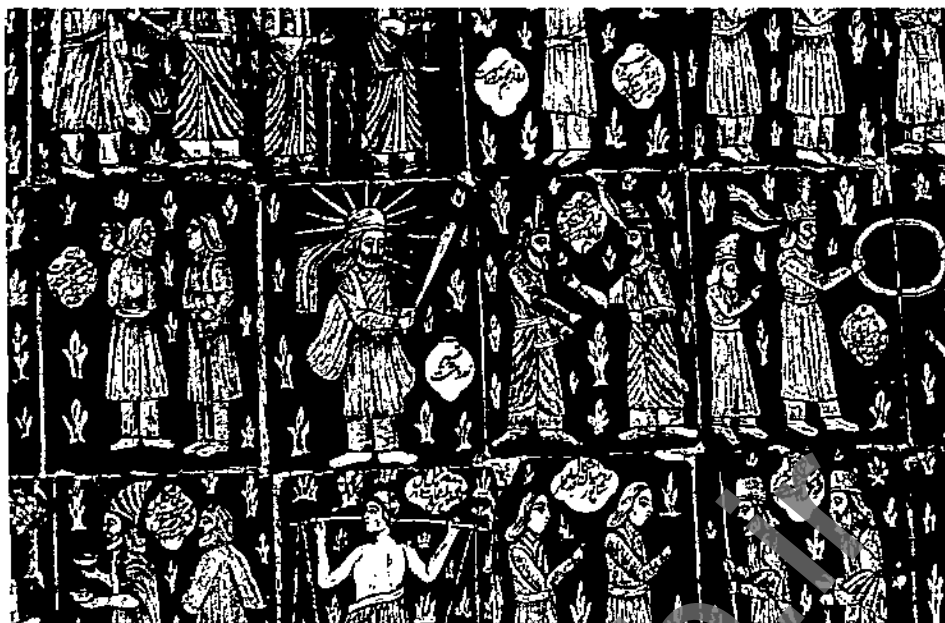
▲ شکل ۲- کاشیکاری، تکیه معارن الملک، کرمانشاه، سده سیزدهم هجری

به دلیل این توجه، علاقه به حفاری در مناطق باستانی روز به روز بیشتر می‌شود. آنچه از فعالیت‌های باستانشناسی در ایران به جای مانده می‌توان به اولین زمینه فعالیت‌های رسمی آن در منطقه باستانی شوش اشاره کرد که در بین سال‌های ۱۲۲۹-۳۱ شمسی انجام پذیرفته است.