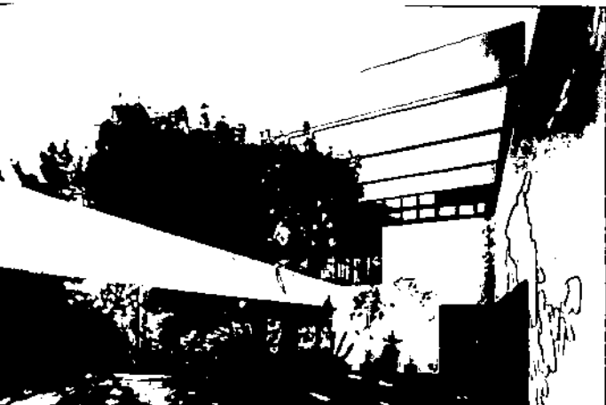
خانه لاول بیچ