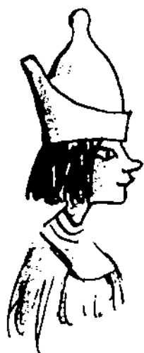
کلئوپاترا ملکه‌ی مصر