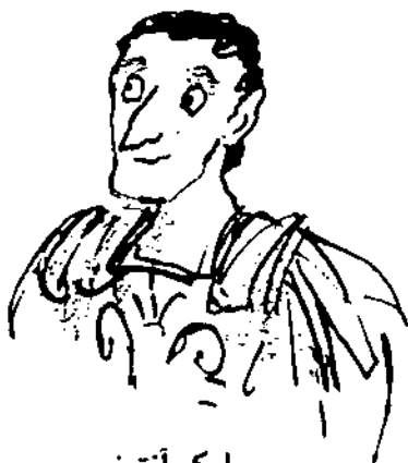
مارک آنتونی یکی از سه فرمانروای روم