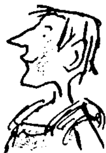
سریوس داستان‌گو محافظ آنتونی